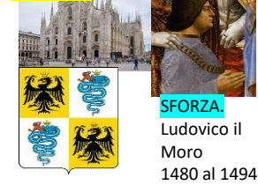
SFORZA Ludovico il Moro 1480 al 1494