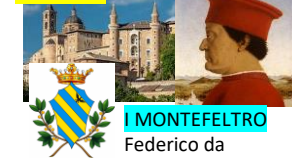
I MONTEFELTRO Federico da Montefeltro 1422-1482