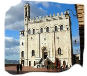
Palazzo dei Consoli- Gubbio